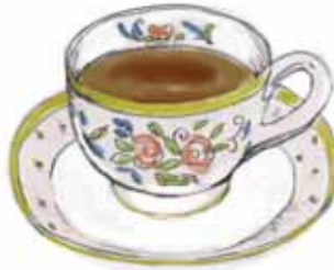
ブレンドコーヒー