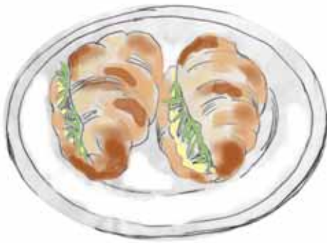
クロワッサンサンド